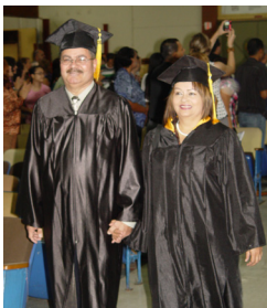
niveles 1 y 2.

Nuevamente nuestra iglesia se vistió de gala. En esta ocasión los protagonistas fueron los estudiantes del Instituto Bíblico, de los