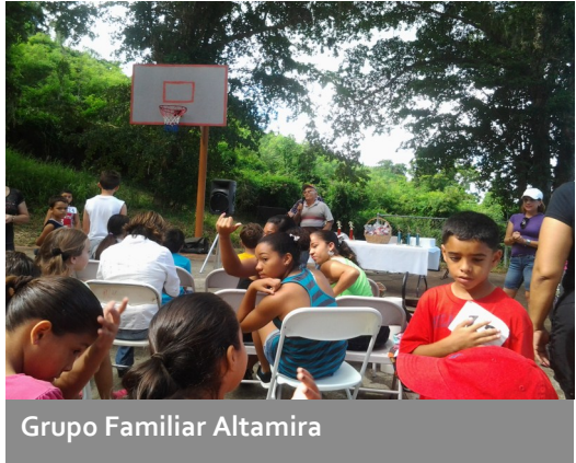
Grupo Familiar Altamira