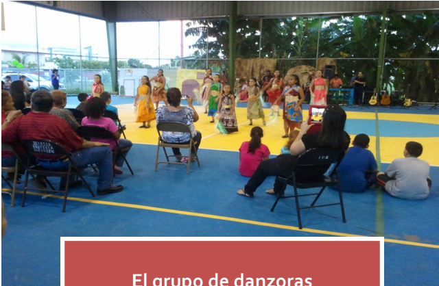
El grupo de danzoras