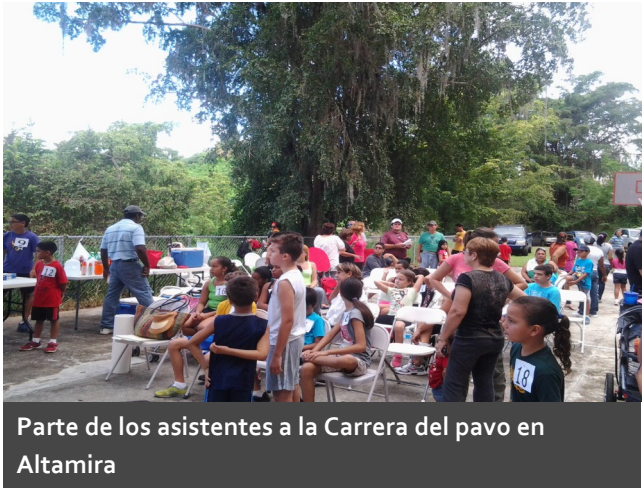
Parte de los asistentes a la Carrera del pavo en Altamira