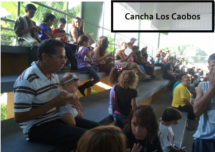
Cancha Los Caobos

El grupo familiar de Altamira en Juana Diaz realizó la carrera del pavo en su área. Los organizadores de dicha actividad, liderada