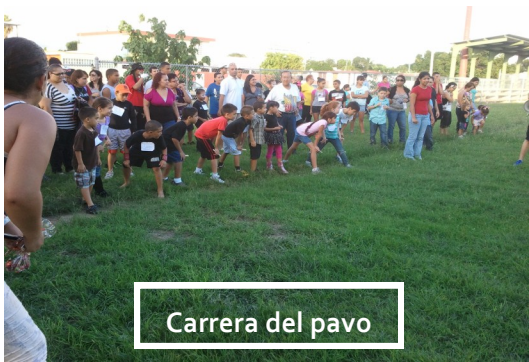
Carrera del pavo